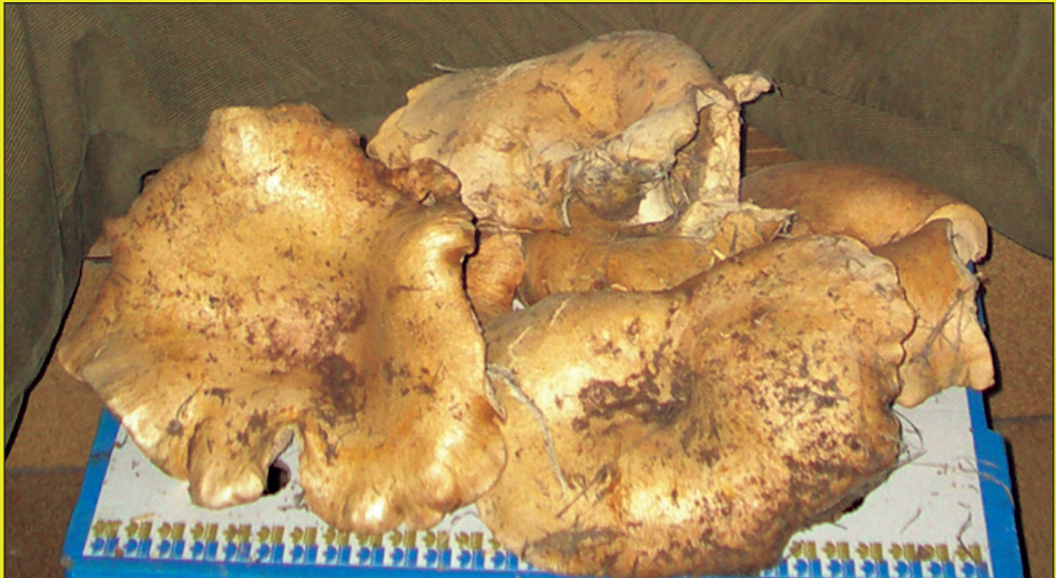
Aquests magnífics exemplars de rovellons es van trobar a prop de la zona d'acampada, a la Rodana del nostre terme