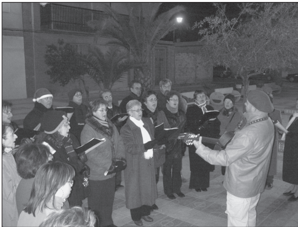
Ronda de nades per la Coral Benicalaf i Concurs de Betlems Particulars (28-12-05)