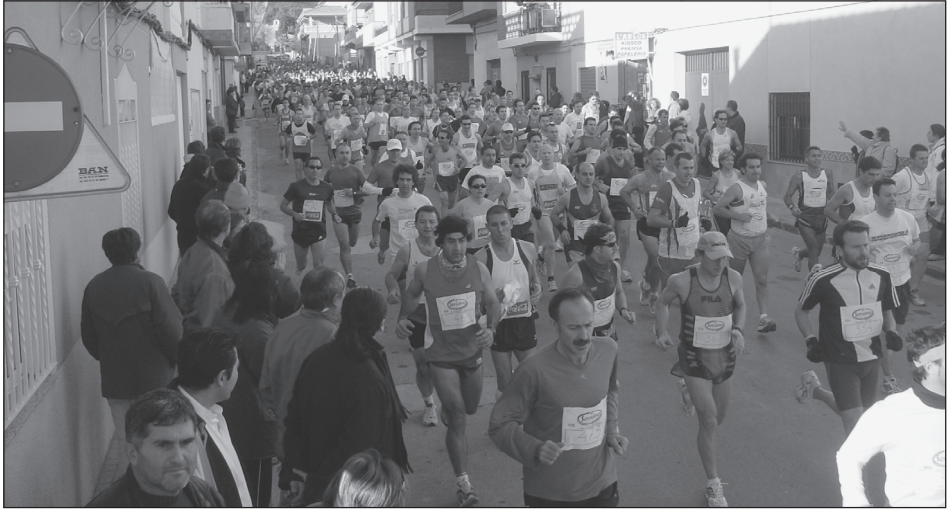
XVIII Mitja Marató Popular la Vall de Segó (11-12-05)