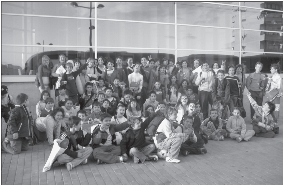
Visita Expojove (27-12-05)