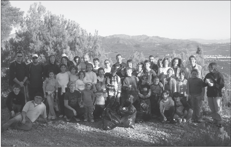
Eixida per les sendes de la Rodana (03-12-05)